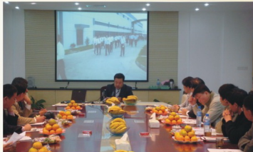
高校科研基地（水基研讨会）