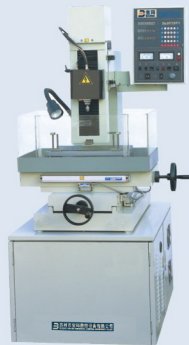
宝玛DB703型高速电火花小孔机

本产品是高精度水基磨削液，适用于铸铁、碳钢、合金钢、不锈钢、铝和铝合金、铜和铜合金及非金属材料的精密磨削加工，对提高工件表面质量和延长砂轮使用寿命具有明显效果。