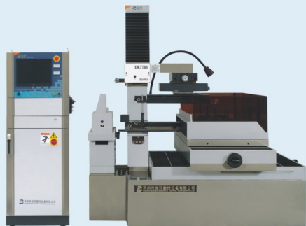
宝玛2008型闭环控制中走丝线切割机