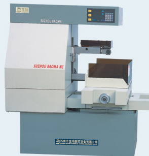
宝玛环保型电火花线切割机