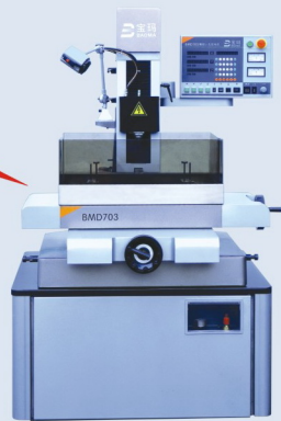
宝玛BMD703精细小孔加工机系列