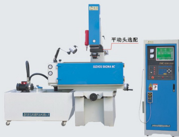
宝玛EDM电火花成型机系列

BM系列环保型线切割专用水基工作液由100%纯水性物质配制，具有良好的清洁性、润滑性和环保性能，对环境无污染、对人体无危害，属于国家绿色环保的高新技术产品。与传统乳化油相比切割效率更高，表面光洁度更好，电极丝损耗更低，适用于各类电火花线切割加工冷却之用。