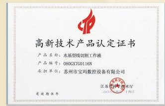
高新技术产品（已通过）