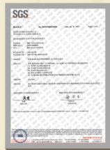
通过欧盟RoHS化学测试实验 取得SGS-CSTC国家权威环保认证